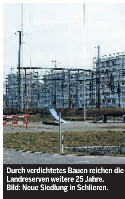
Durch verdichtetes Bauen reichen die Landreserven weitere 25 Jahre. Bild: Neue Siedlung in Schlieren.

Das Siedlungsgebiet, festgelegt im kantonalen Richtplan, umfasst insge-